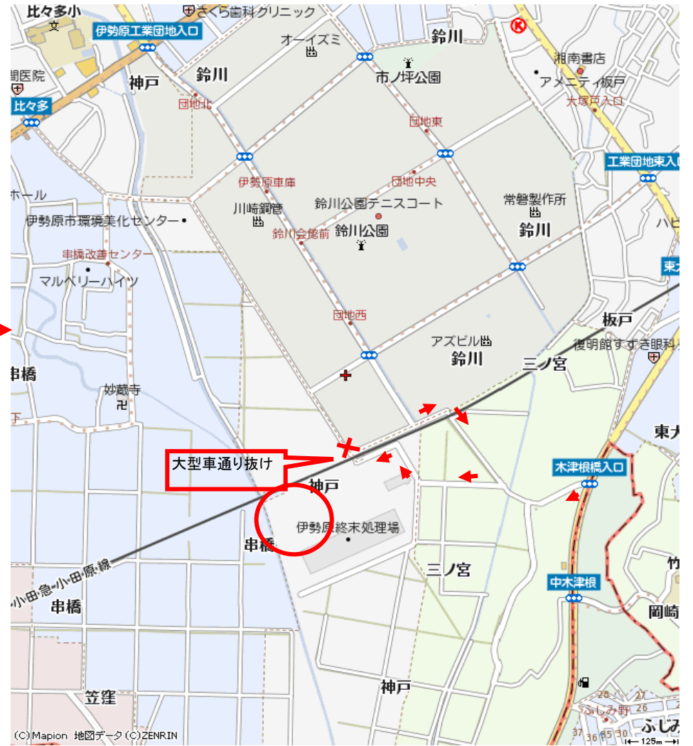
伊勢原市スポーツ広場（伊勢原市神戸120番地 終末処理場脇）