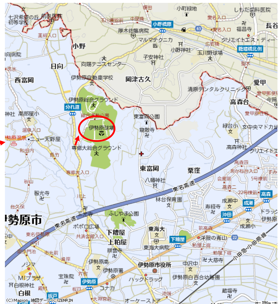
予備日 伊勢原市総合運動公園（伊勢原市西富岡320番地）